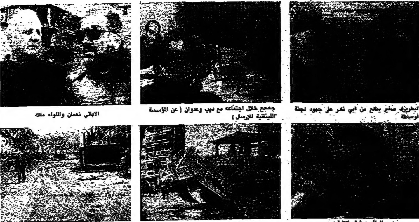
الوزير صفر يطرح من ابي نادر على وجود لجنة الوساطة (من اليمين: صفر، عون، عن المؤسسة اللبنانية للارسال)